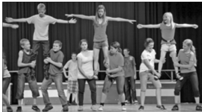
Die musikalischen Vorträge wurden durch akrobatische Einlagen aufgelockert.