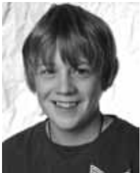
Christian Minder Zimmermann Weingartner Holzbau AG Oberkirch