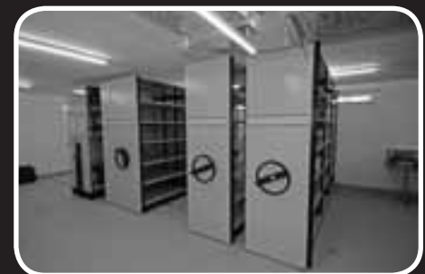
Das neue Archiv