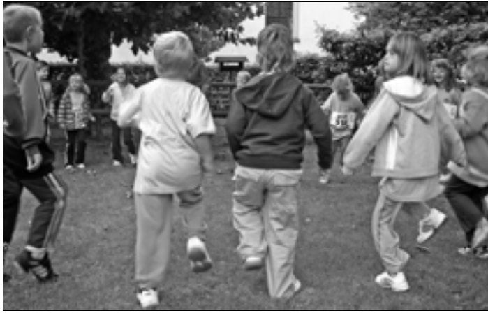
Kinder bereiten sich auf den Willisauer Lauf vor.

Am Dienstag, 30. August 2011, beginnt ein weiteres KITU-Jahr. Wir turnen jeweils am Dienstag in der Steinacherhalle. Wenn du bis zum 31. Dezember 2011 deinen 5. Geburtstag feierst oder bereits in den Kindergarten gehst, dann turne ich von 15.30 Uhr bis 16.30 Uhr mit dir. Gleich anschliessend von 16.30 bis 17.30 Uhr ist Turnen für die Kinder der 1. und 2. Klasse angesagt. Ich freue mich auf lustige, erlebnisreiche und spannende Turnstunden mit euch.