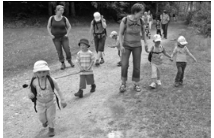
Auf dem Muki-Reisli der Enziwigger entlang zum Breiten-Spielplatz.