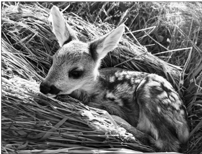
Dieses Rehkitz wurde am 20. Mai 2020 fotografiert.

Die drei Jagdgesellschaften von Hergiswil bedanken sich bei allen Landwirten recht herzlich für ihren Einsatz zu Gunsten der Rehkitzrettung. Sie haben sich rechtzeitig bei den Jagdgesellschaften gemeldet, wenn ihnen der Mähtermin bekannt war oder haben selber bei der Absuche der Mähwiesen mitgeholfen. Das Mähen der Wiesen anfangs Sommer bedeutet für frisch gesetzte Rehkitze Todesgefahr, da sich diese oft im hohen Gras verstecken und sich bei Gefahr ducken.