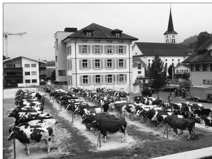
Letzte Viehschau vom 13. Oktober 2016.