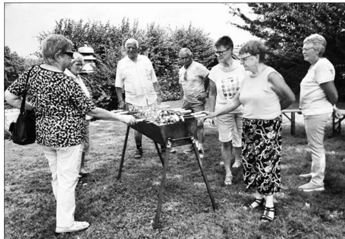
Jeder ist sein eigener Koch.