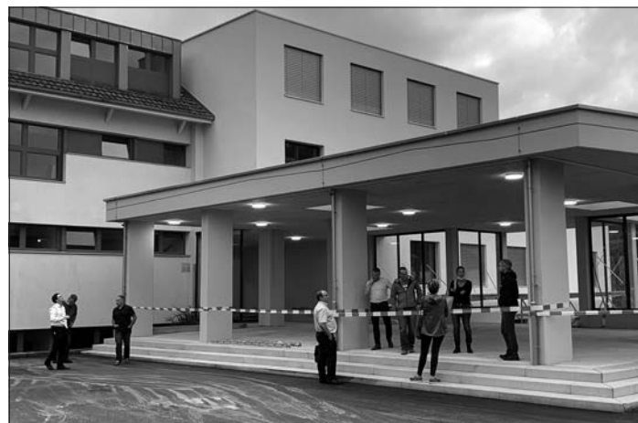
Die Baukommission bespricht anlässlich ihrer Sitzung Mitte August die letzten Details.

Die Baukommission und die Schule Hergiswil b. W. freuen sich auf diesen speziellen Tag und heissen alle herzlich willkommen.