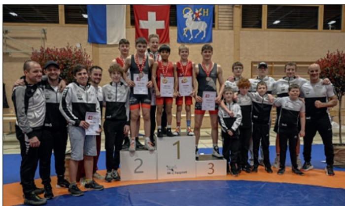
Alle Teilnehmer sowie die Trainer der Ringerriege Hergiswil.