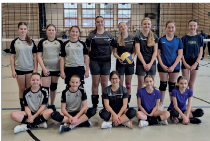
Spielerinnen der Kategorie Jugend.

Um 11.00 Uhr begannen die Wettkämpfe von 16 erwachsenen Mannschaften. Langjährige, treue Hergiswiler, Willisauer, Menzberger, Zeller, Buttisholzer und neue Mixed Mannschaften hatten sich angemeldet. Als Elite, Aktive, Plausch und Mixed wurden sie in 4-er-Gruppen eingeteilt und wer da schon die Nase vorn hatte, konnte auf einen Rang im vorderen Feld hoffen. In den Pausen konnten sie sich im Netzball-Beizli auf der Bühne verpflegen.