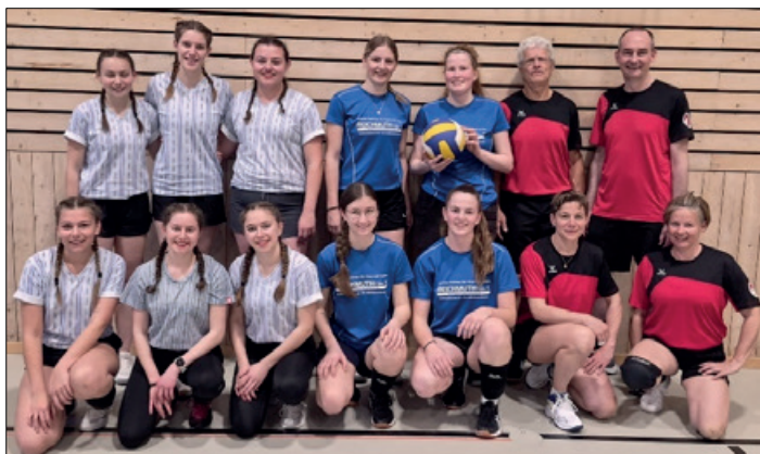
Von links: Buttisholz 3, KTV Laupersdorf, Crazy Girls, und Viva Menzberga, Ibach, «Ehschrecklech netti Mannschaft».