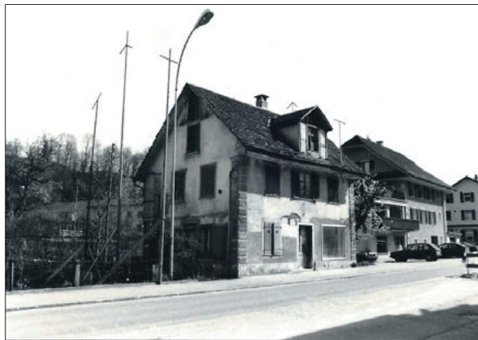
Liegenschaft Zuberhöfli in den 90er-Jahren.