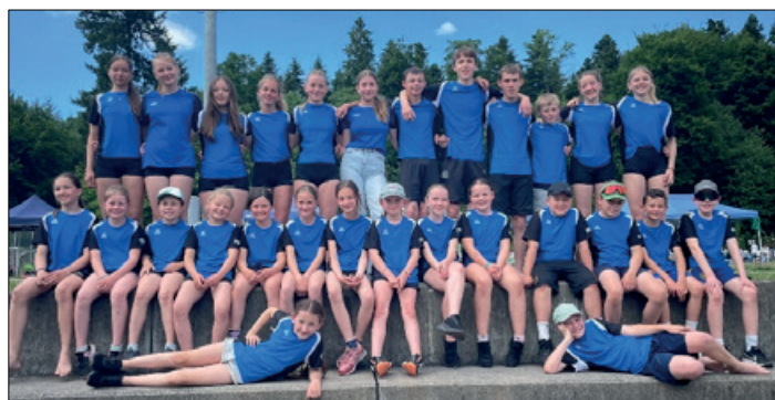
Gruppenfoto vom Jugitag 2025.