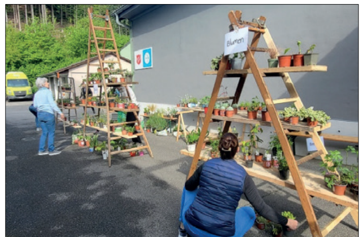
Letzte Handgriffe vor dem Ansturm.

Samstag, 2. Mai 2026; 10.00–13.00 Uhr Sagenstrasse 20, Dagmersellen